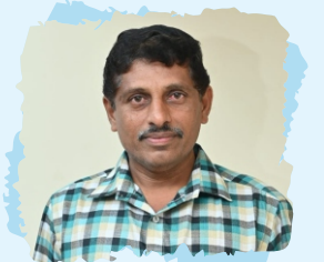
அரிமா P.ரமேஷ் செயலாளர் சேவை