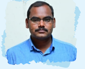
அரிமா N.வஜ்ரவேல் செயலாளர் நிர்வாகம்

வரும் மாதங்களில் நடைபெறும் நிகழ்முறை கூட்டத்திற்கும், சேவை திட்டங்களுக்கும் பொருளீட்டு திட்டமான இனிப்பு, பட்டாசு விற்பனையிலும் தங்களுடைய மேலான முழு ஒத்துழைப்பை வழங்கி வெற்றி பெறச் செய்ய வேண்டுகிறோம்.