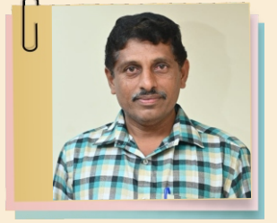
அரிமா P.ரமேஷ் செயலாளர் சேவை