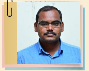
அரிமா N.வஜ்ரவேல் செயலாளர் நிர்வாகம்